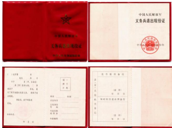
《士官退出现役证》样式: